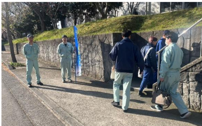
あいさつ運動の様子