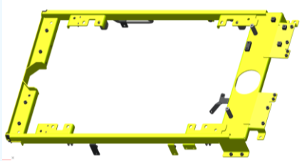
FRAME, TOP 完了

日本側の皆様には、さまざまな場面でご支援をいただくことになるかと思いますが、今後ともどうぞよろしくお願いいたします。