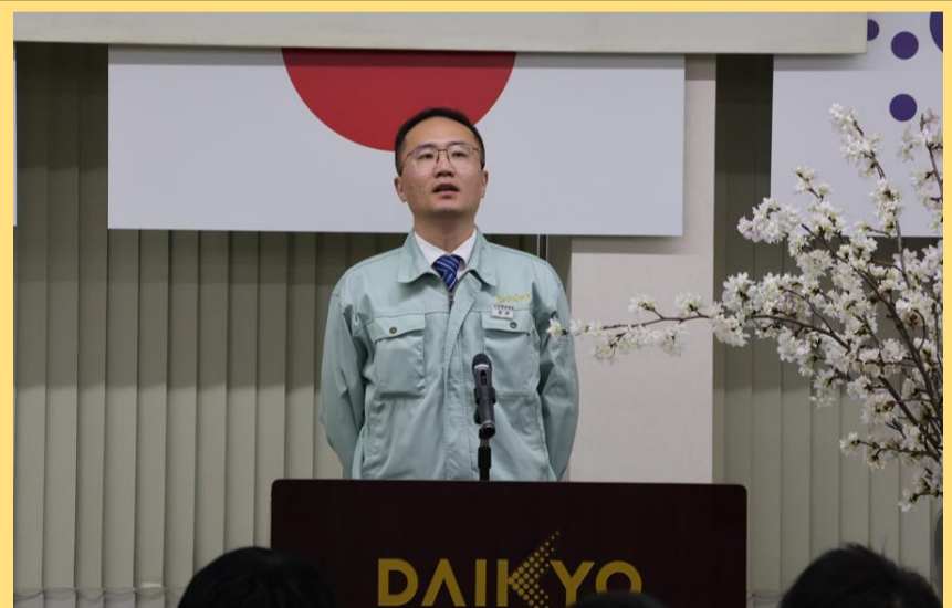
4月朝礼での帰任挨拶の様子

節目の年を迎える今、ここで得た学びを胸に、次の地でも根を張り、実を結ばせていきたいと考えております。これまで賜りましたご厚情に、心より深く感謝申し上げます。