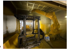
キャブロボット塗装トライ