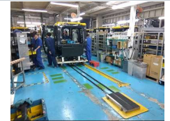
組立ブルキャブライン

また、工場全体の5Sを見直そうと掲げた『きれいな工場づくり』も少しずつではありますが班長会活動や皆さんの協力で結果が出てきています。まだまだ途上です。